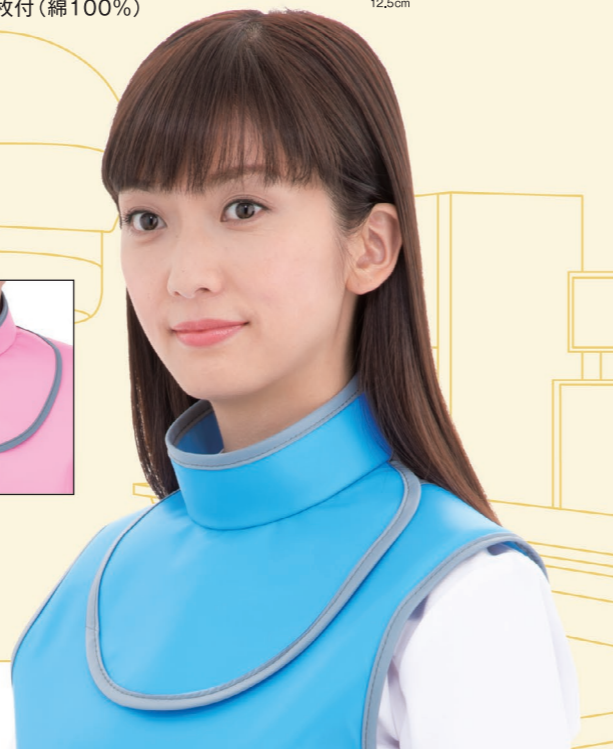
写真はカバーを装着していない状態です。